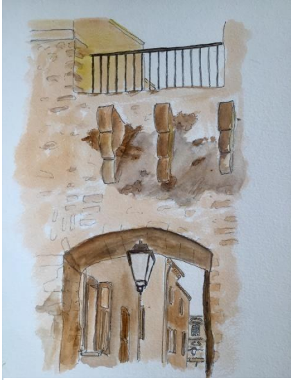
Dessin réalisé par Lionel GUIN (2019)

La seule porte encore en état, sur les trois qui perçaient la deuxième enceinte, date du XIV e siècle (classée avec tous les remparts en 1948).